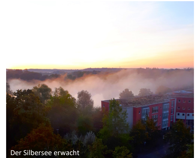
Der Silbersee erwacht